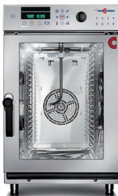
10.10 mini (10 x 1/1 GN)