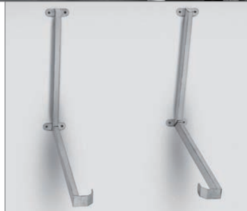
Fixation murale flexible