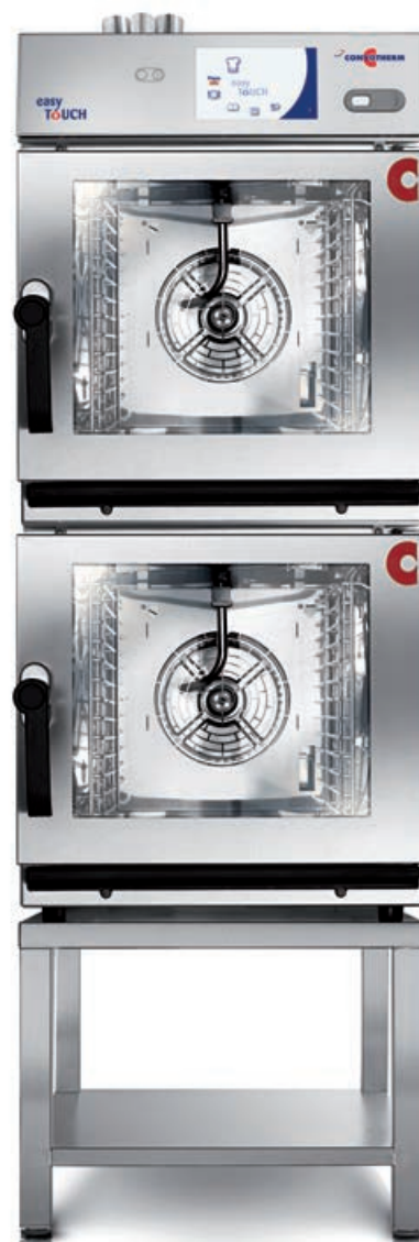
6.10 mini 2en1 (2 x 6 x 1/1 GN)