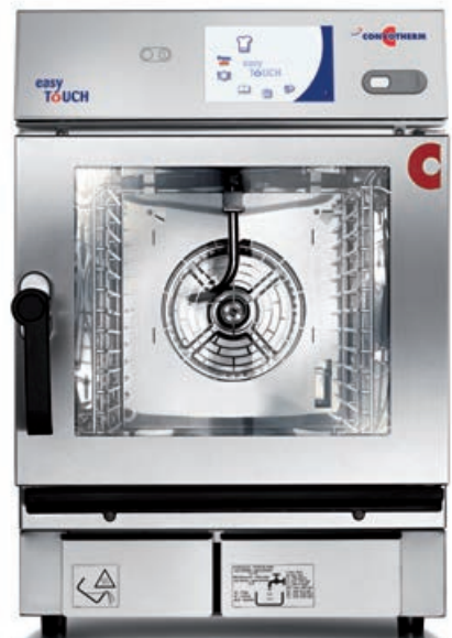
6.06 mini mobile 6 x 2/3 GN 6.10 mini mobile 6 x 1/1 GN