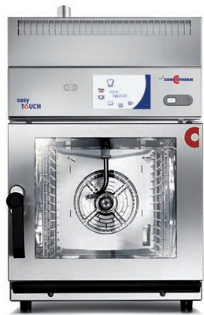
Hotte de condensation CONVOVENT mini idéale pour les cuisines ouvertespaces