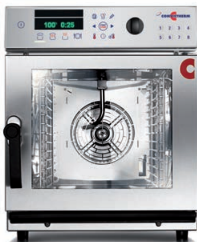
6.06 mini (6 x 2/3 GN) – également mobile 6.10 mini (6 x 1/1 GN) – également mobile

Notre série mini propose quatre fours mixtes en différentes dimensions :