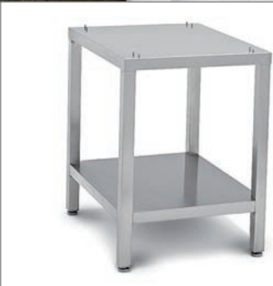
Support adapté à chaque four