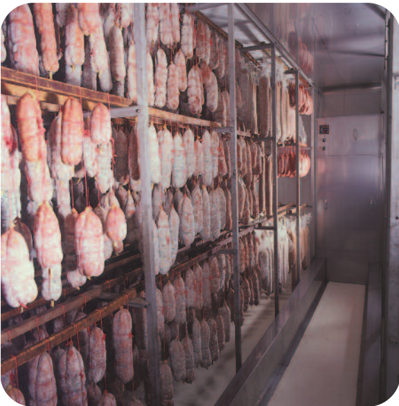
SECHOIR VUE DE DESSUS